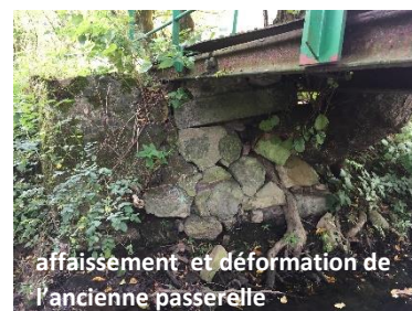
affaissement et déformation de l'ancienne passerelle

Contacté par l'association pour la défense des chemins ruraux des Hauts-de-France en juin 2017 pour effectuer le recensement des chemins ruraux avec les communes volontaires, Anor a répondu positivement et très rapidement pour que ce dernier puisse s'effectuer. Grâce à ce travail, une première opération concrète a pu être programmée sur l'un des 54 chemins recensés et notamment sur le n°24 dit Chemin de la Vieille Verrerie . En effet, l'ancienne passerelle , surplombant le ruisseau des Anorelles et permettant de passer d'une rive à l'autre, présentait de nombreux signes de vétusté et justifiait donc une intervention afin d'assurer les meilleures conditions de sécurité notamment aux promeneurs empruntant ce chemin.