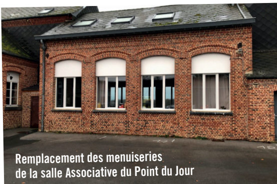
Remplacement des menuiseries de la salle Associative du Point du Jour