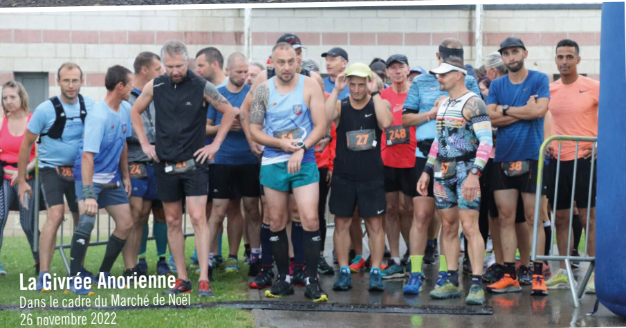
La Givrée Anorienne Dans le cadre du Marché de Noël 26 novembre 2022