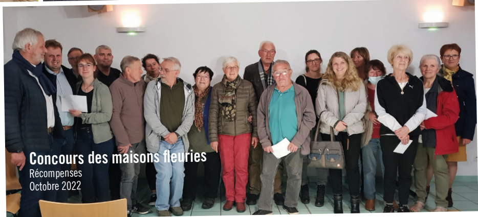
Concours des maisons fleuries Récompenses Octobre 2022