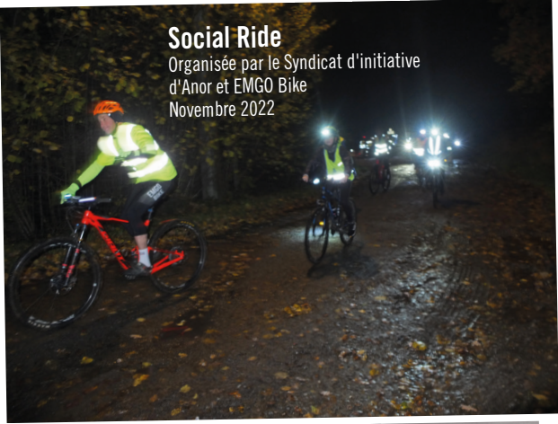
Social Ride Organisée par le Syndicat d'initiative d'Anor et EMGO Bike Novembre 2022