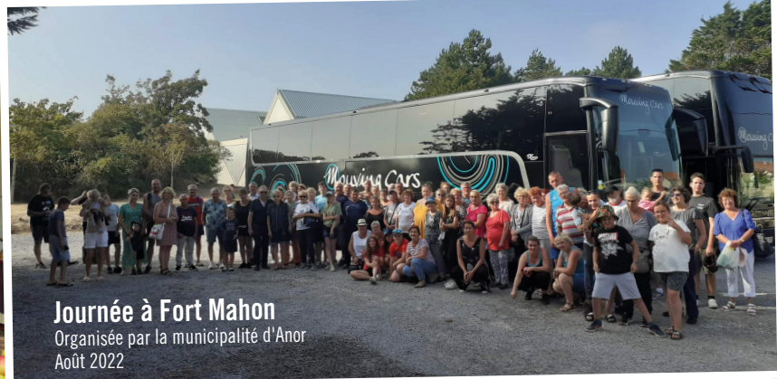
Journée à Fort Mahon Organisée par la municipalité d'Anor Août 2022