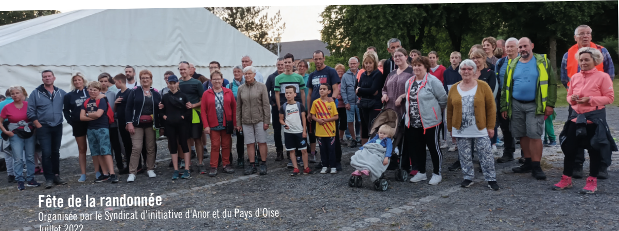
Fête de la randonnée Organisée par le Syndicat d'initiative d'Anor et du Pays d'Oise Juillet 2022