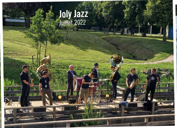
Joly Jazz Juillet 2022