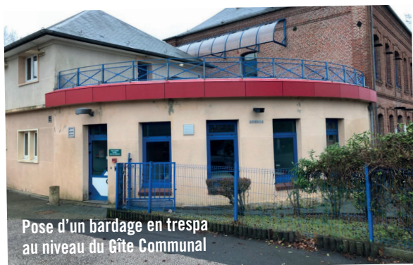
Pose d'un bardage en tressa au niveau du Gîte Communal