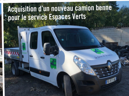
Acquisition d'un nouveau camion benne pour le service Espaces Verts