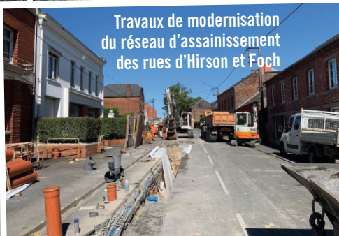
Travaux de modernisation du réseau d'assainissement des rues d'Hirson et Foch