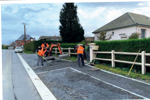
Création d'un chemin piéton et de places de stationnement au niveau de la Rue du Revin