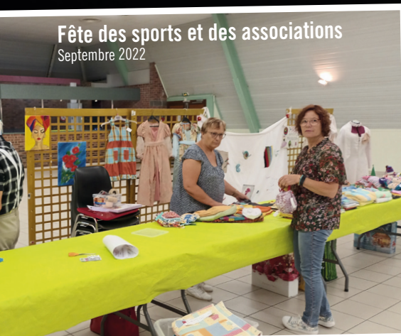
Fête des sports et des associations Septembre 2022