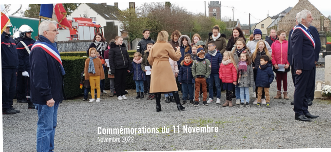
Commémorations du 11 Novembre Novembre 2022