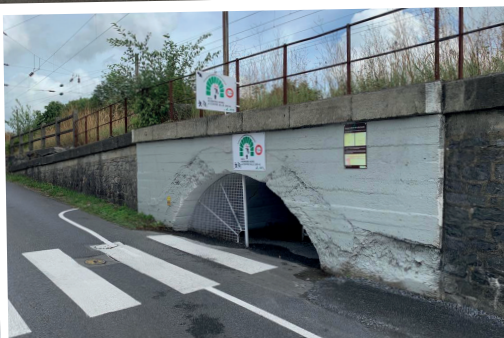
Remise en service du passage piéton de la « tête baissée »