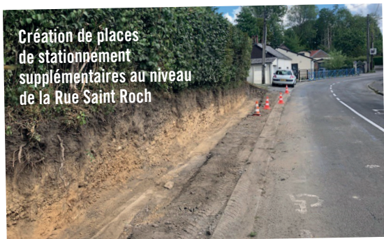
Création de places de stationnement supplémentaires au niveau de la Rue Saint Roch