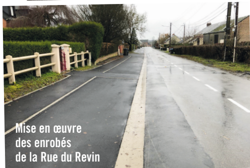
Mise en œuvre des enrobés de la Rue du Revin