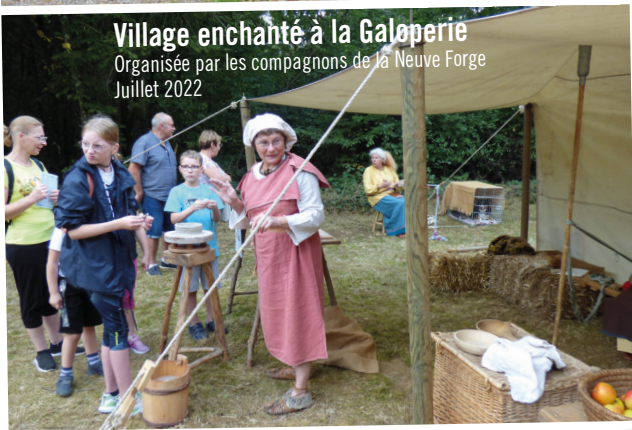
Village enchanté à la Galopierie Organisée par les compagnons de la Neuve Forge Juillet 2022