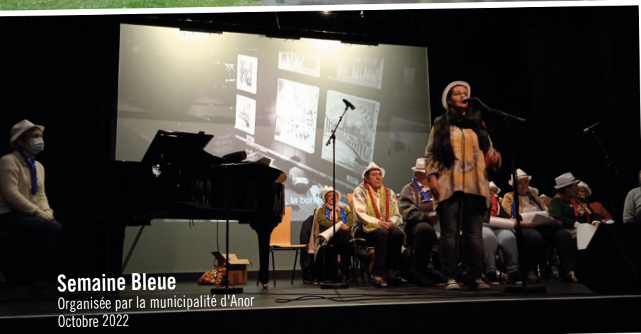
Semaine Bleue Organisée par la municipalité d'Anor Octobre 2022