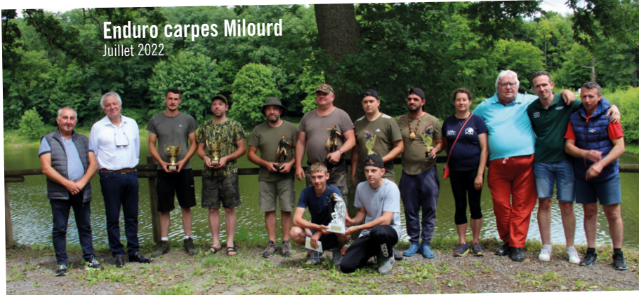
Enduro carpes Milourd Juillet 2022