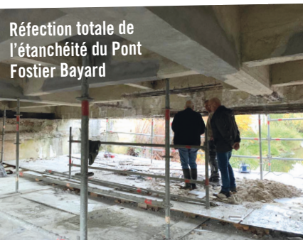
Réfection totale de l'étanchéité du Pont Fostier Bayard