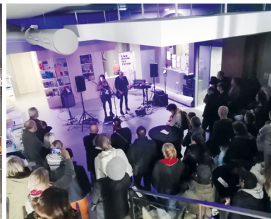
▲ Festival du conte avec des soirées « tout public »