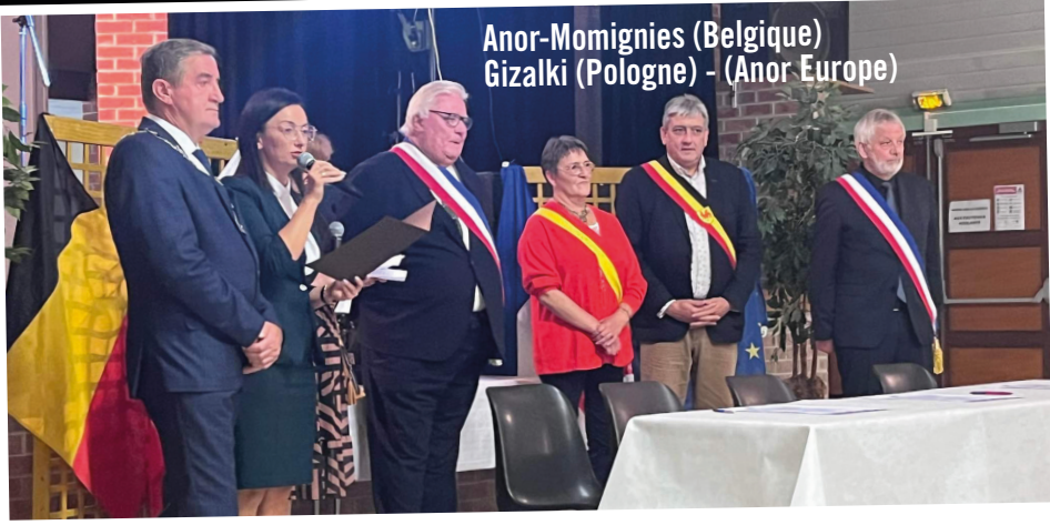
Anor-Momignies (Belgique) Gizalki (Pologne) - (Anor Europe)